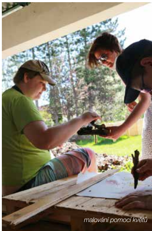
malování pomocí květů