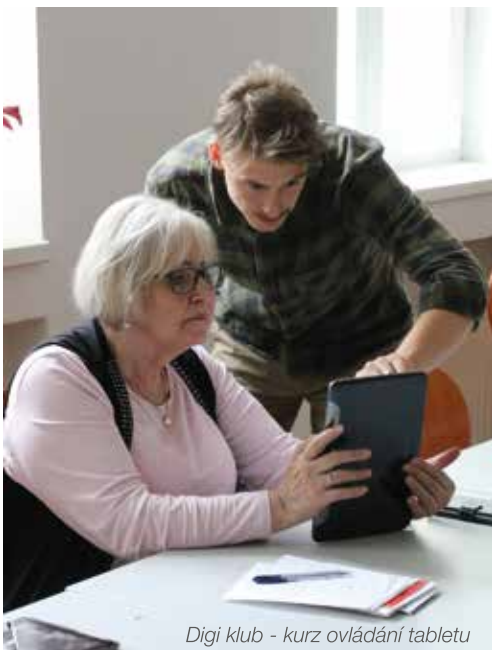
Digi klub - kurz ovládání tabletu

Mezi kolegy ne. Dostal jsem se do výtečného týmu. Setkávat se ale s osudy některých klientů, to náročné bývá. Poznáte mladého