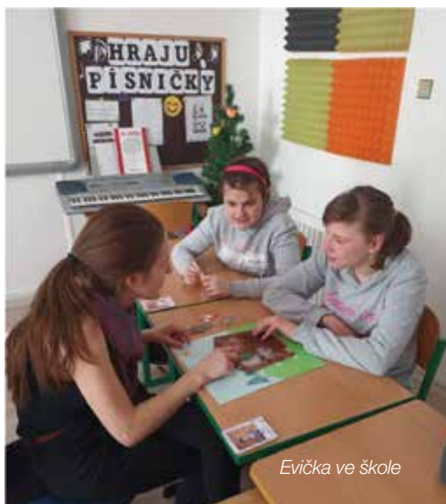
Evička ve škole