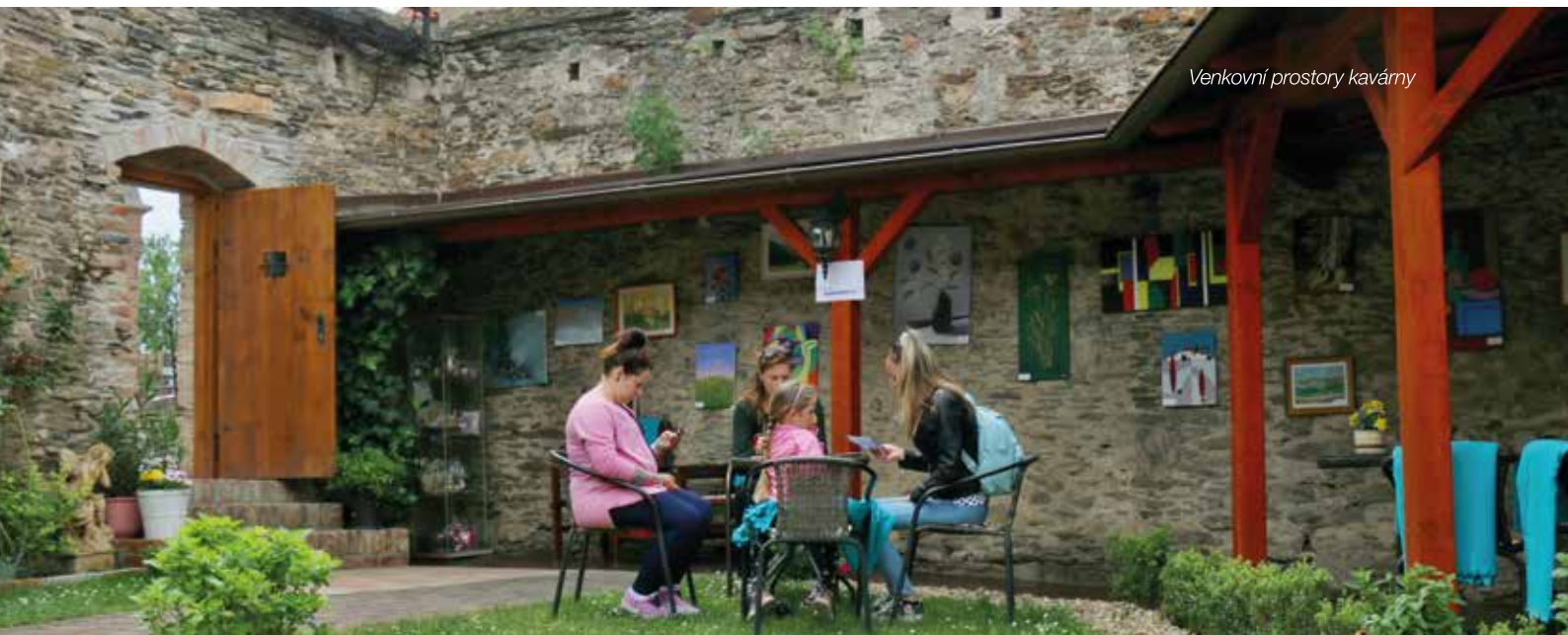
Venkovní prostory kavárny