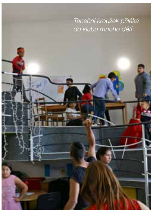
Taneční kroužek přiláká do klubu mnoho dětí