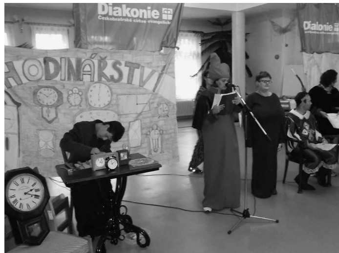
Klienti litoměřického střediska hrají divadlo.

Na provozní a mzdové náklady získaly školy z MŠMT dotaci v celkové výši 50 400 000 Kč. Z dotačního rozvojového programu zaměřeného na financování asistentů pedagoga dalších 6 200 000 Kč. Oproti ostatním střediskům je financování škol v posledních letech stabilizované, přesto je na církevní školy neustále vyvíjen nátlak. Velmi obtížně získáváme povolení k rozšíření počtu žáků, nemůžeme zřizovat nová detašovaná pracoviště. Ministr školství dokonce pohrozil snížením dotací na provoz škol a nutností podílu zřizovatele na jejich financování. Naštěstí byl tento požadavek po intenzivním vyjednávání stažen.