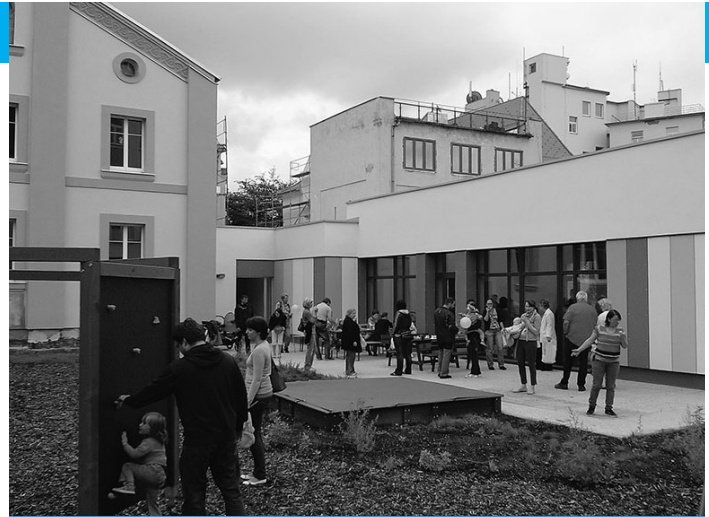
Den otevřených dveří MŠ Diakonie v Chebu.