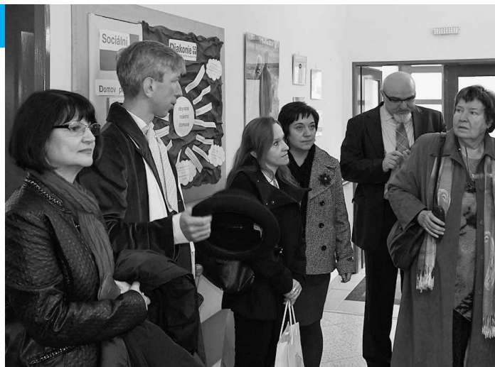
Účastníci oslav 150. let diakonické práce v Krabčicích.