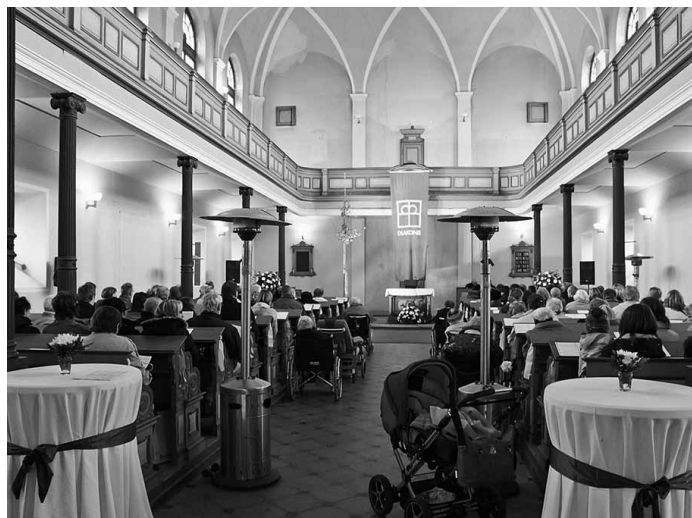
Oslava 150 let začátku diakonické práce v Krabčicích.

Ve spolupráci se Střediskem křesťanské pomoci v Litoměřicích byl zahájen pilotní projekt potenciálně celodiakonické PR/fundraisin- gové akce založené na mnohaletém know-how řady středisek Diakonie při úspěšném pořádání dobročinných aukcí uměleckých děl.