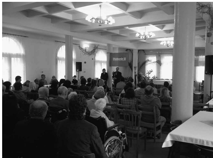
25. výročí obnovení Diakonie ČCE.

Z podobných důvodů bylo v roce 2014 započato slučování dvou