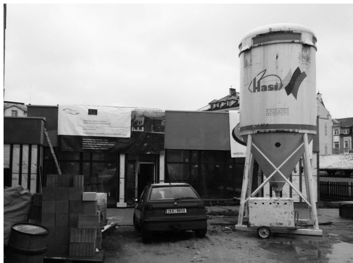
V Chebu stavíme novou mateřskou školku Diakonie.

Koncem roku proběhlo interní grantové řízení na výběr projektů pro následující rok.