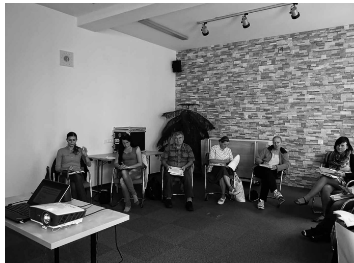
Učebna Diakonické akademie.